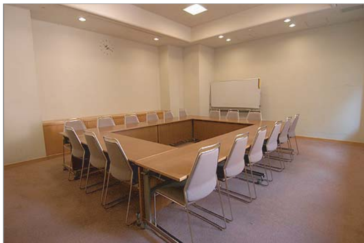
写真のレイアウトは「口の字形式」です