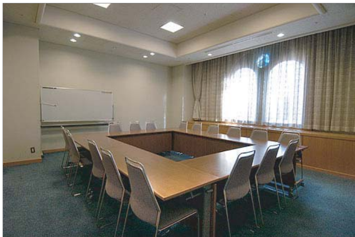
写真のレイアウトは「口の字形式」です