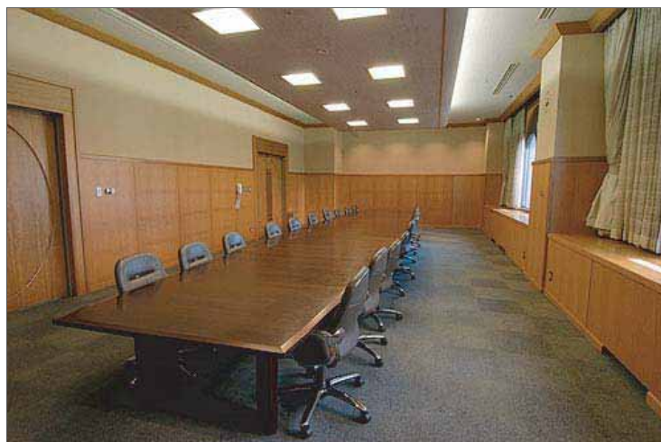
写真のレイアウトは「ボート型形式」です